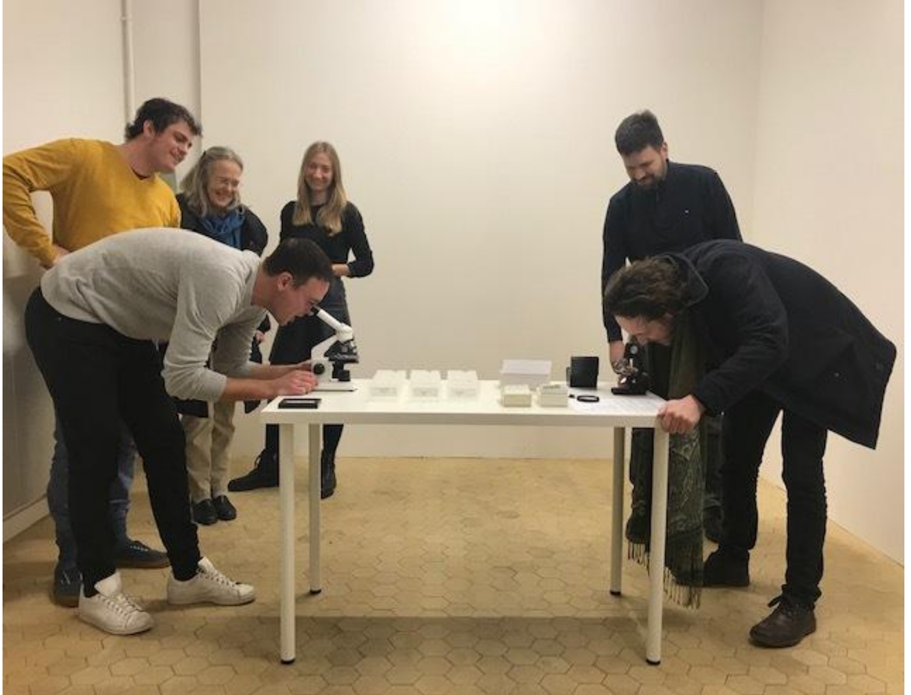
Cabinet de regard: Microlitics , Kunstraum Dreiviertel, 2019, Berna, Svizzera