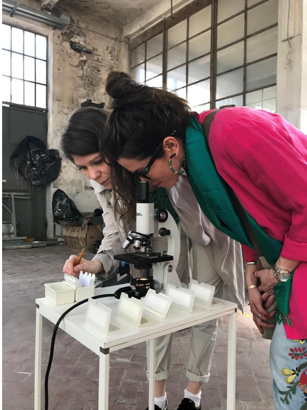
Cabinet de regard: micro&macro, 2018, NoPlace4, Ex Ceramica Vaccari, Santo Stefano di Magra, SP