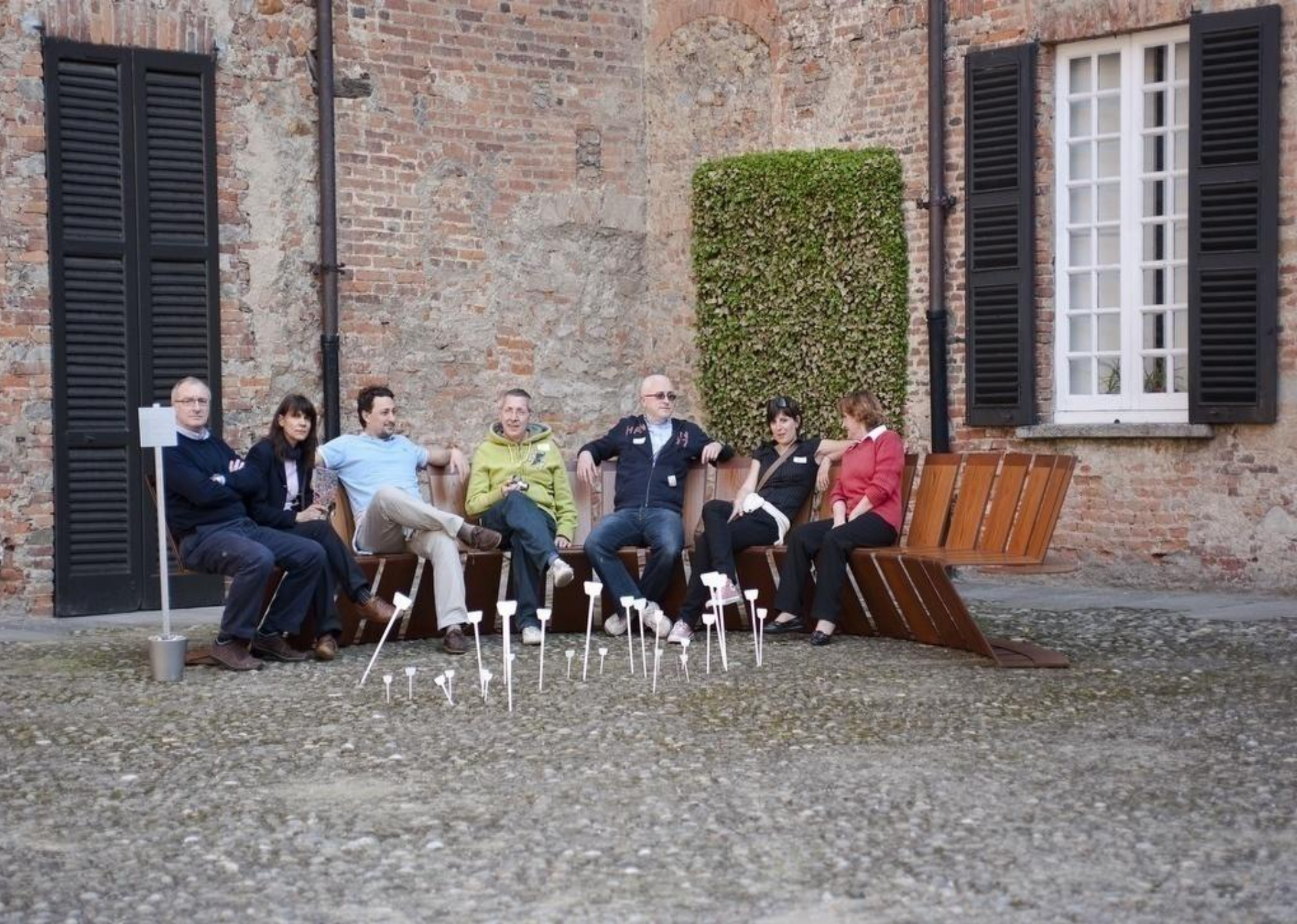
Utopia di un museo invisibile, Aiuola d'attesa , 2010, Castello di Jerago, VA