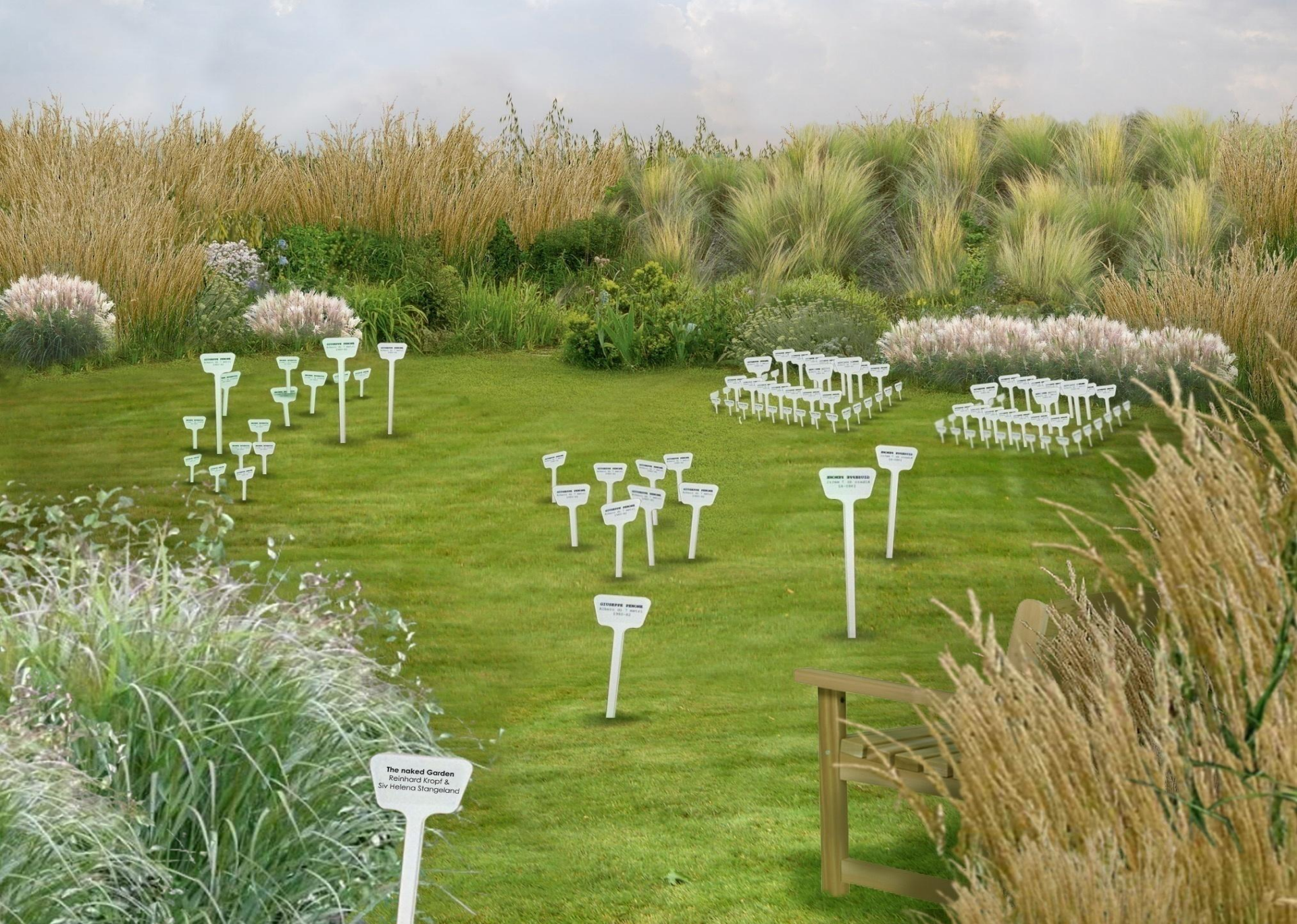
Microcollection selezionata al Premio Pav 2011, PAV Parco d'Arte Vivente, Torino