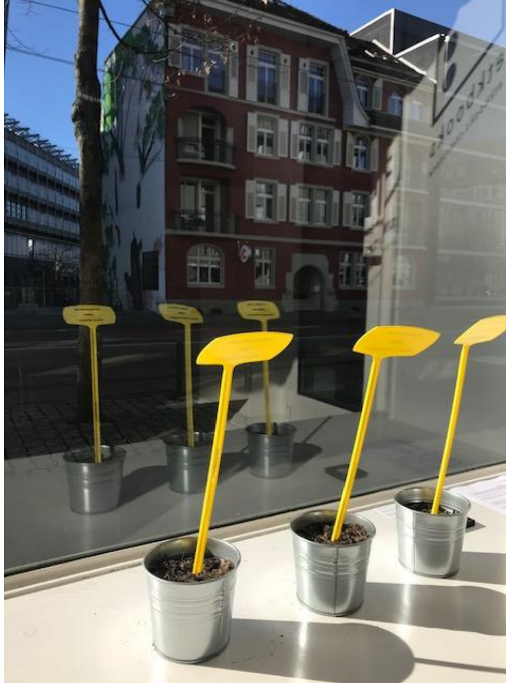
Semina d'arte , Kunstraum Dreiviertel, 2019, Berna, Svizzera