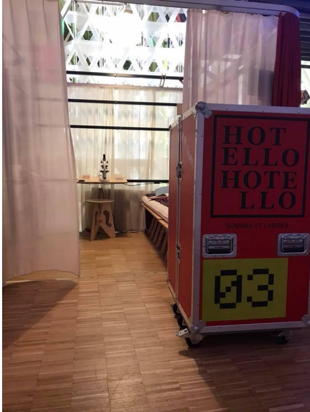
Cabinet de regard: micro&macro, 2018 in Hotello Abitare un ritardo, 999 domande, Triennale di Milano