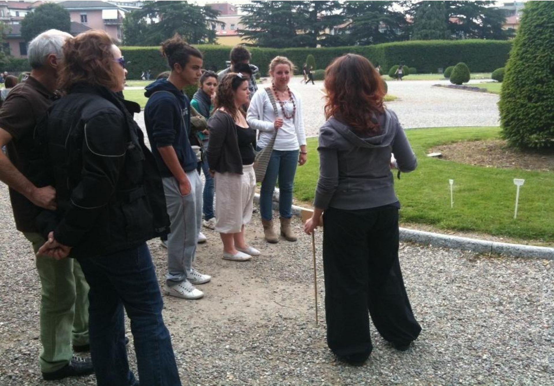
Visite Guidate a Semine d'arte in Art Day del Liceo Artistico Frattini, 2012, Varese