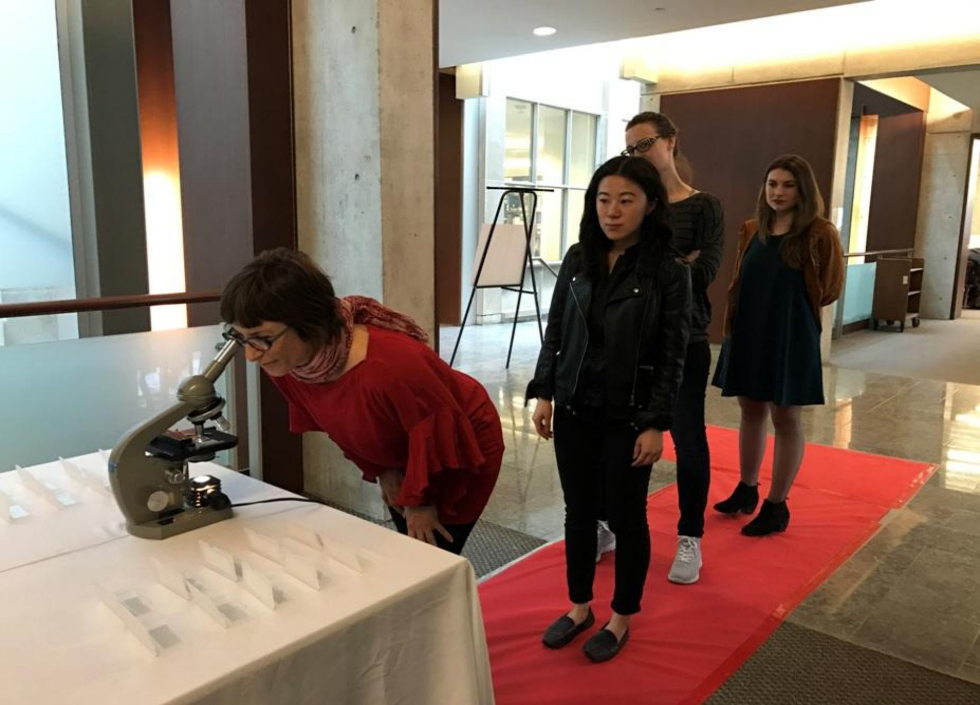
Cabinet Project a cura di ArtSci Salon, Università di Toronto, 2017