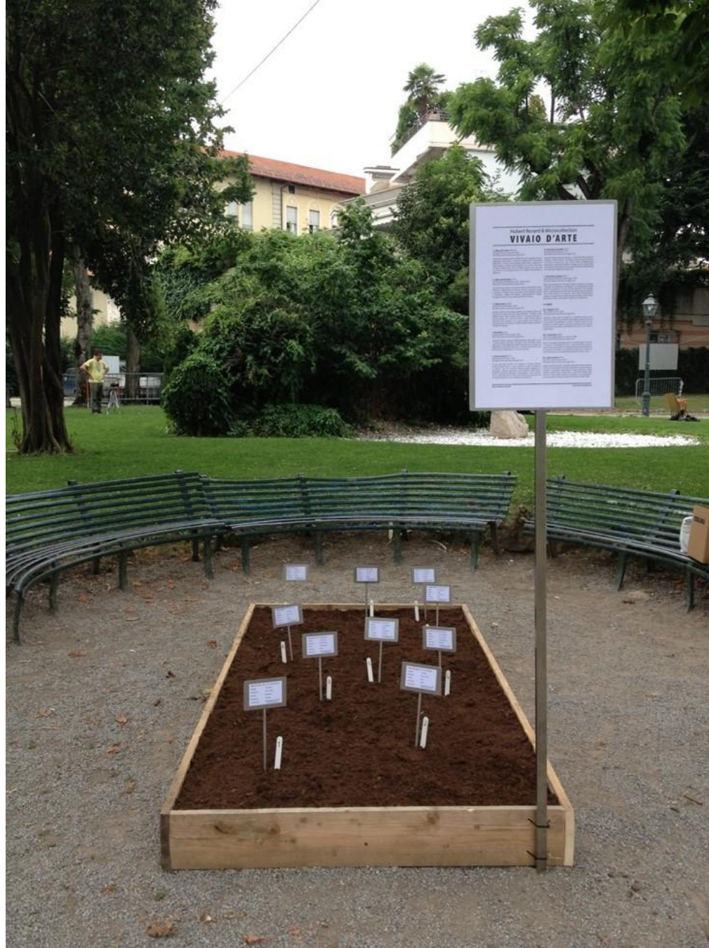
VIVAIO D'ARTE in collaborazione con Hubert Renard, ZOOart, 2014, Cuneo