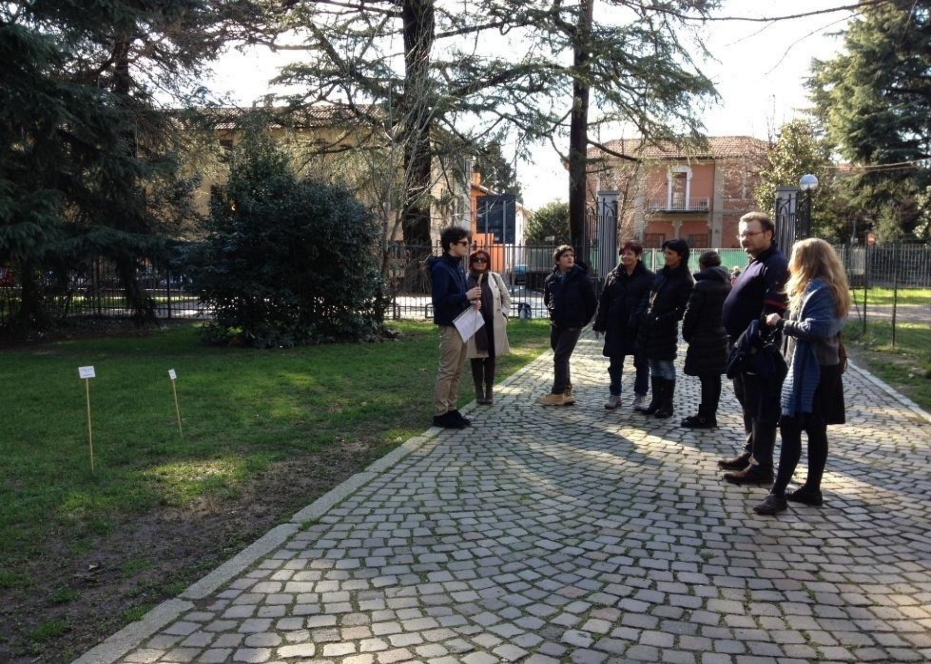
Visite Guidate a Semine d'arte in Metti in circolo il pittore, Olgiate Olona, VA, 2014