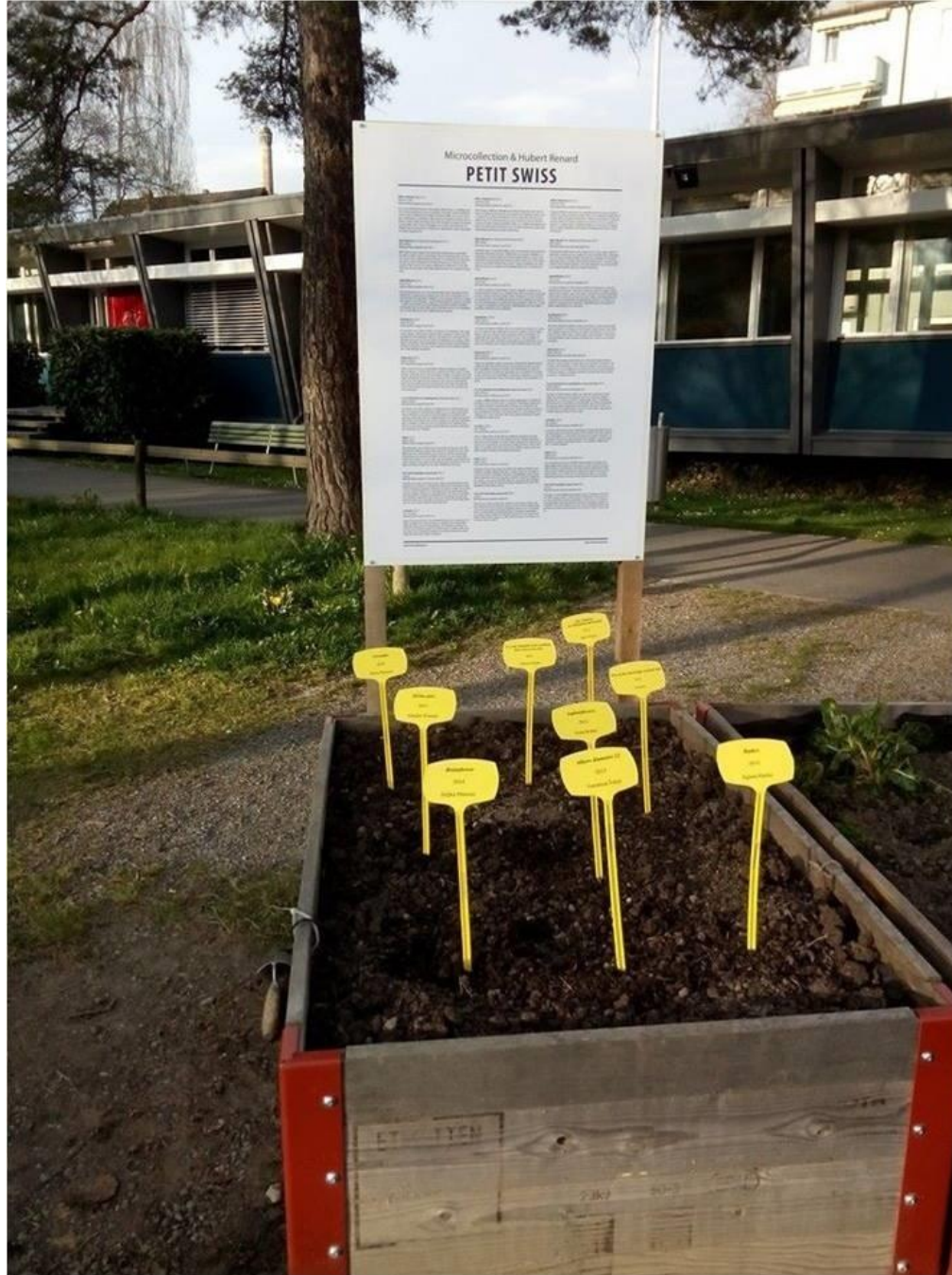
Semina d'arte: Petit Swiss, 2015 in collaborazione con Hubert Renard, Merkgarten, Zurigo