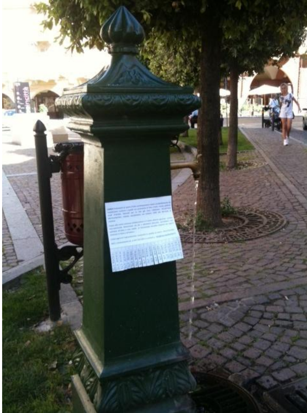
Microcollection cerca nuovi frammenti di opere d'arte contemporanea...