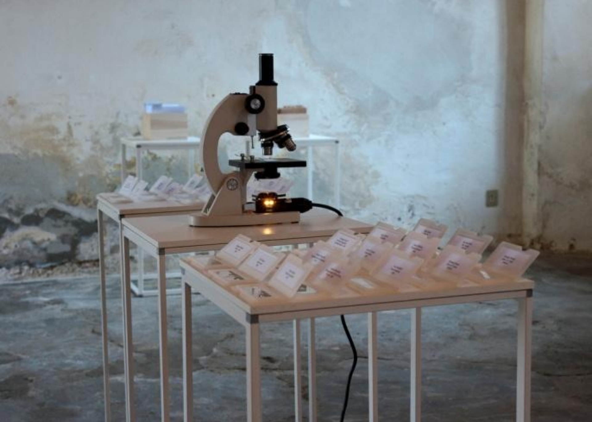
Utopia di un museo invisibile, Cabinet de regard: aiuola d'attesa , 2010, Castello di Jerago, VA