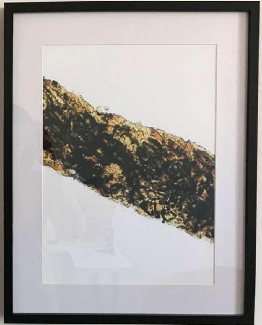
Summer collection: Pipilotti Rist & Mario Merz, 2017 - 2 fotografie, cm 29.7 x 42, multiplo 1/5