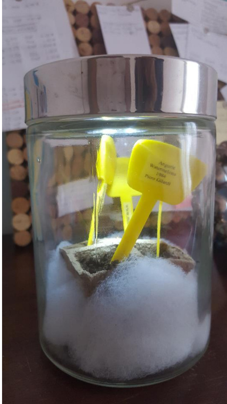
Germogliatore: Angurie, 1984, Piero Gilardi