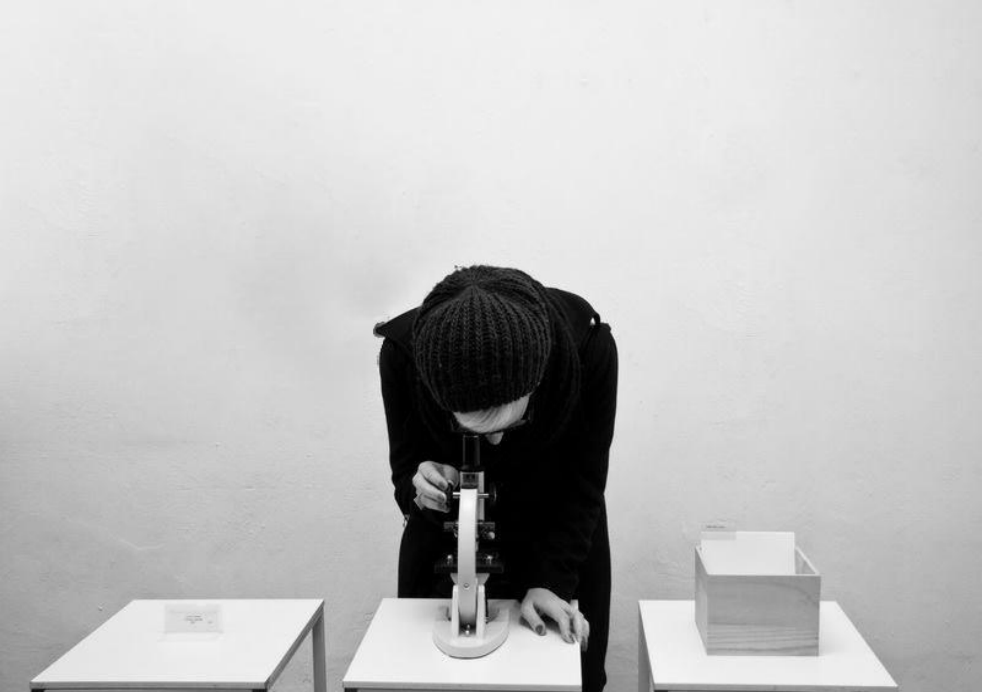
Spazio Pachiderma/Motelb: Cabinet de regard : Lucio Fontana, 2013, Brescia