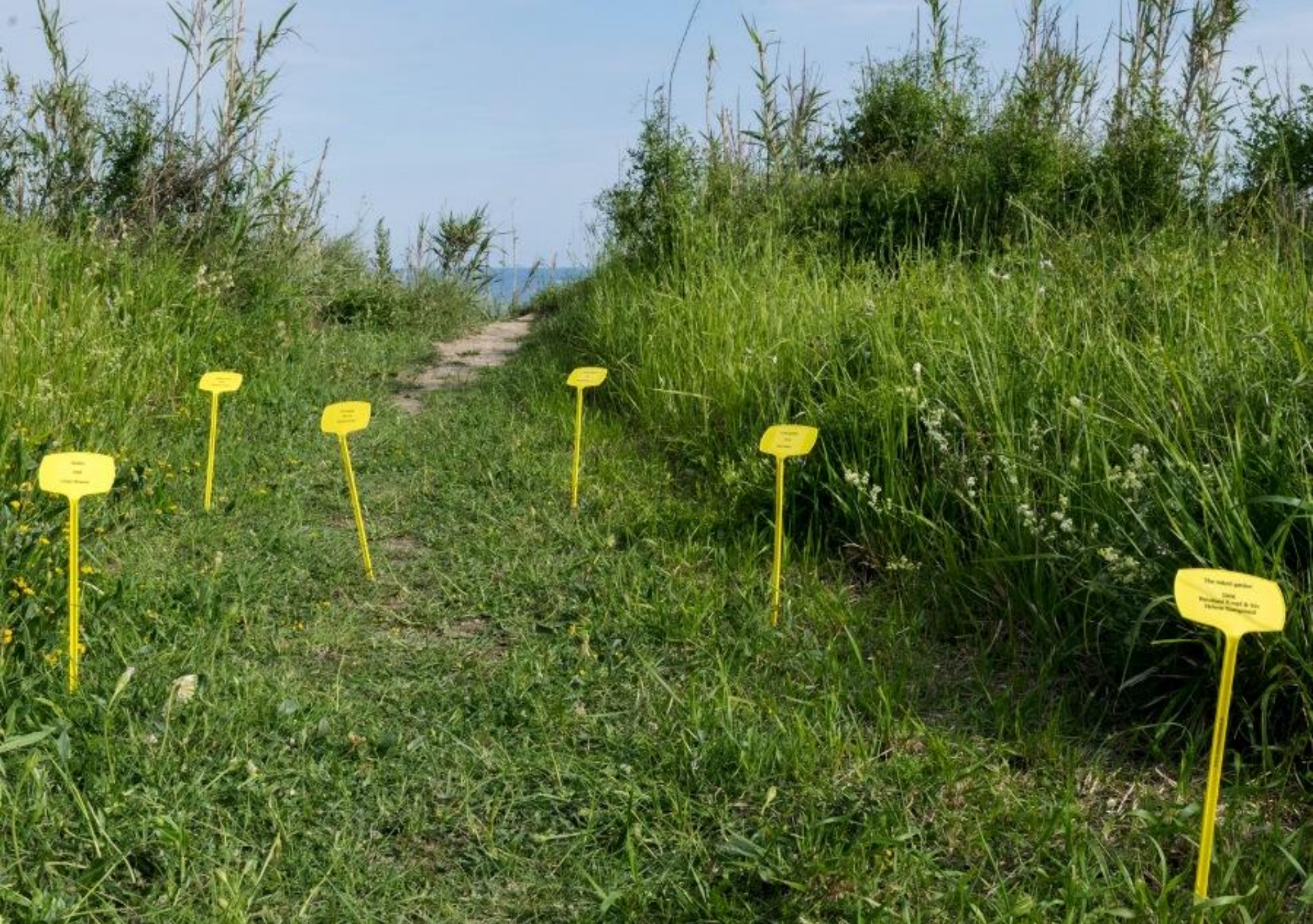
Semina d'arte: Gardens, 2016 Susak Expo 2016, Susak, Croazia