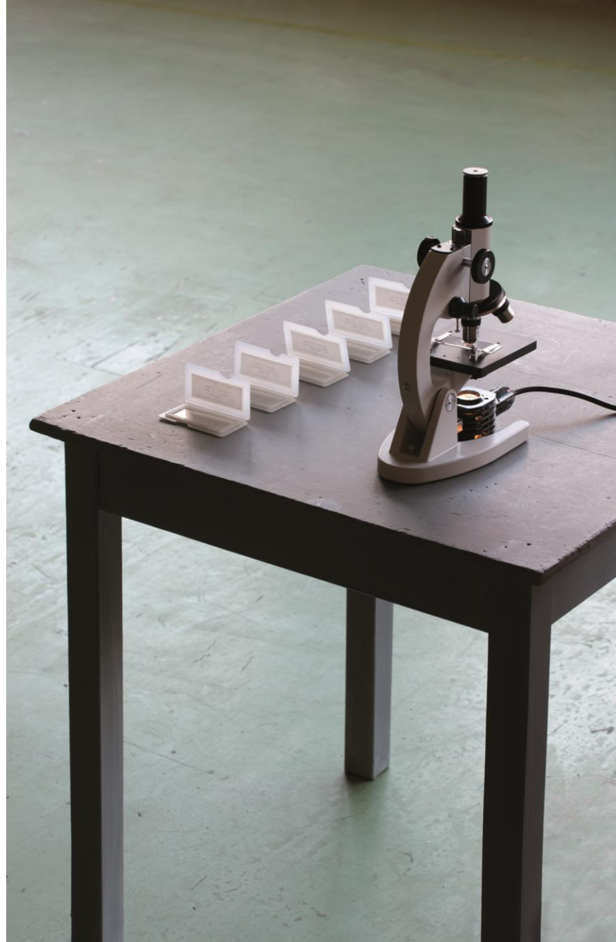
Roaming Repetita iuvant - Cabinet de regard : Giulio Paolini, 2008, Assab One, MI